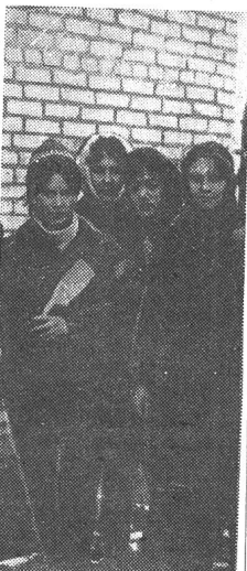
Закончен трудовой день, но уходить домой не хочется: где коллектив — там весело. Девушки ф и з ико-математического факультета после работы на строительстве нового общежития.