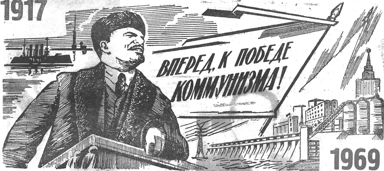
Полетания всех стран, соединяйтесь!