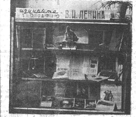
Рисунок и фото автора.

Выставка «Изучайте биографию В. И. Ленина» состоит из трех разделов: