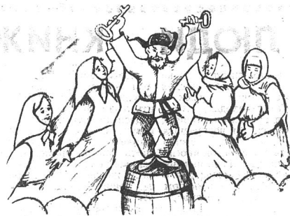
Рисунок О. ЛАРИНОЙ.