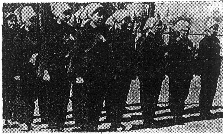
Наши дружинницы на старте