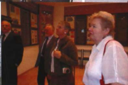
Гости из Польши в музее истории ТГПУ