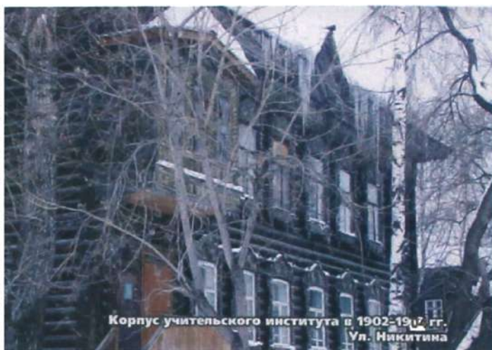
Корпус учительского института в 1902-1912 гг. Ул. Никитина

В настоящее время в старейшем педагогическом вузе Сибири получают высшее образование двенадцать тысяч студентов дневного и заочного отделений, и готовятся к защите кандидатских диссертаций более двухсот аспирантов.