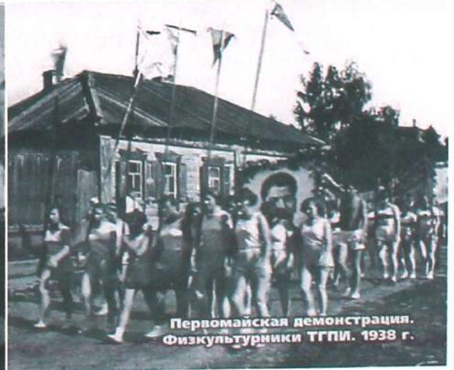
Первомайская демонстрация. Физкультурники ТГПИ. 1938 г.