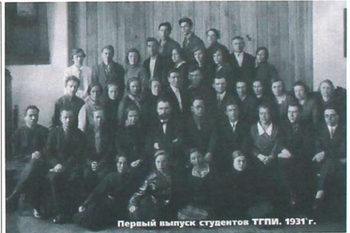
Первый выпуск студентов ТГПИ. 1911 г.