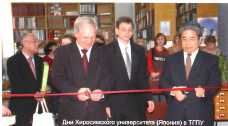
Дни Хиросимского университета (Япония) в ТГПУ