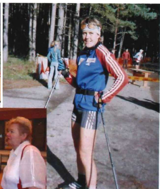
Выпускница ТГПУ, олимпийская чемпионка Наталья Баранова - Масалкина