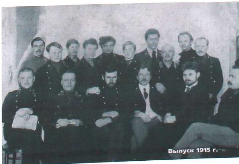
Выпуск 1915 г.