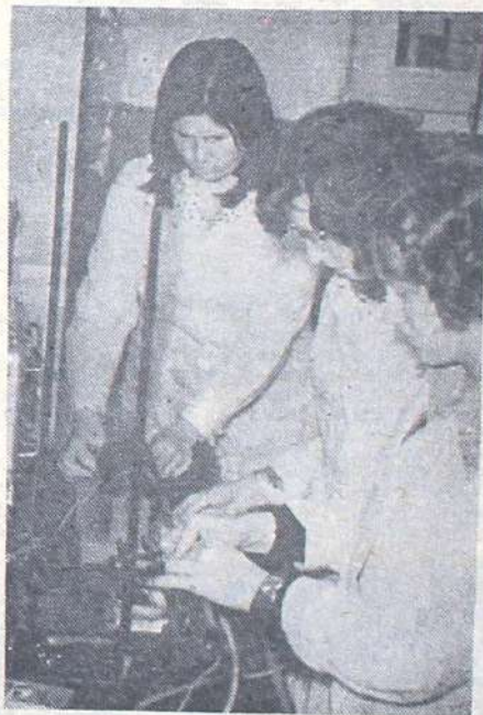
«Клуб выходного дня и его роль в воспитании детей» рекомендован для использования в работе школ области.

Оргкомитет отмечает хорошую организацию работы конференции на факультетах биолого-химическом, иностранных языков, русского языка и литературы.