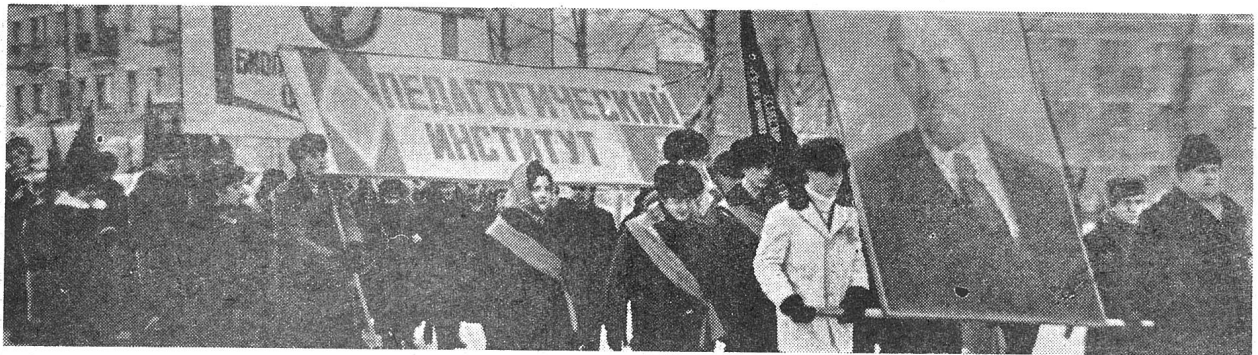
Пролетарии всех стран, соединяйтесь!