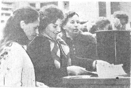
Идет голосование депутатов.