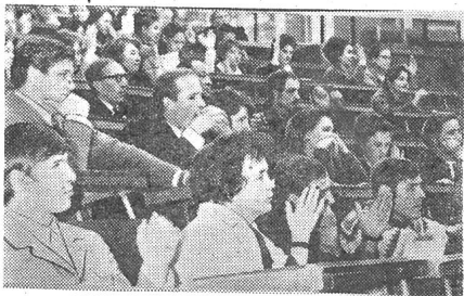
Конференция принимает решение.