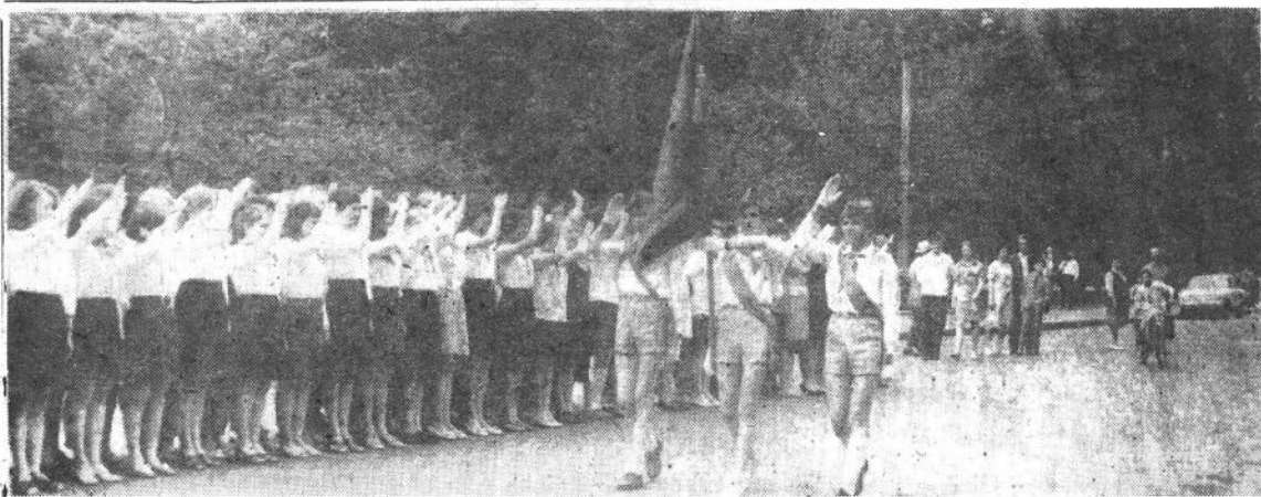
Равнение на знамя.

И помните, мы члены СОВ-73, всегда готовы оказать вам помощь! СОВ-73.