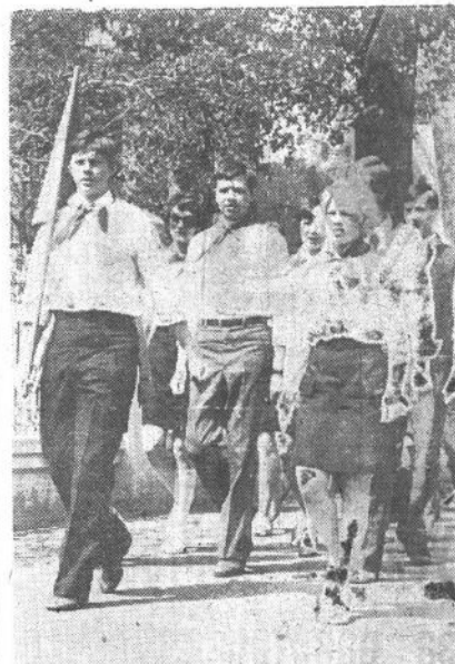
Дерзай, работай, думай и твори! Пусть галстуки пылают, как зарницы! Пусть новою прекрасною странцею В историю войдут дела твои.

Пионерский вожатый — страстный, увлеченный своим делом человек, своей идейной убежденностью и личным примером он воспитывает у пионеров сознательную дисциплину, настойчивость в достижении цели, умение преодолевать трудности.