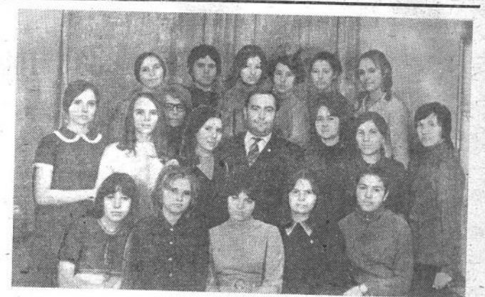
Фотоотряд А. Петрова.