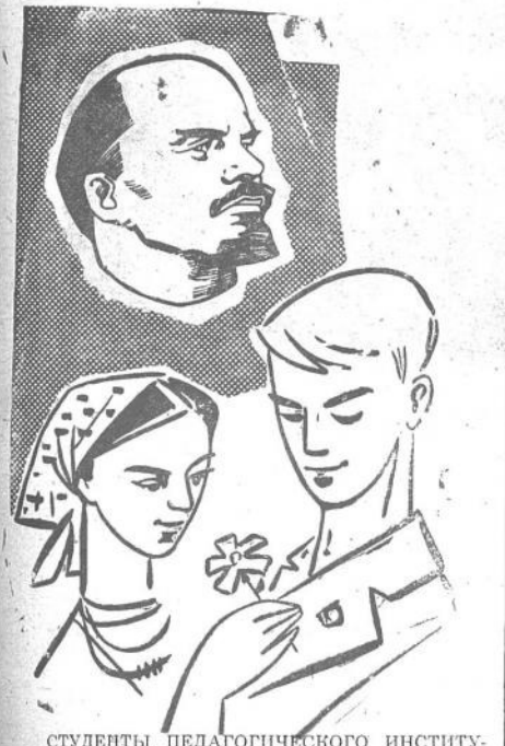
СТУДЕНТЫ ПЕДАГОГИЧЕСКОГО ИНСТИТУТА ВСТРЕТИМ ДЕНЬ РОЖДЕНИЯ В. И. ЛЕНИНА АКТИВНОЙ РАБОТОЙ НА КОММУНИСТИЧЕСКОМ СУБВОТНИКЕ! 20 АПРЕЛЯ — ВСЕ НА «КРАСНУЮ СУБВОТУ»!