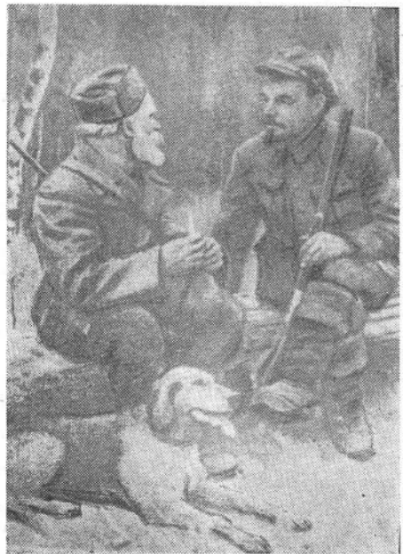
Задачи охраны природы в решениях съездов партии при участии В. И. Ленина

Все ленинское — высочайший идеал. Достижение этого идеала дается только в результате упорной и самоотверженной работы. Мы должны помнить, что Владимир Ильич всегда гордился своей Родиной, народом, природой, но учил умению замечать недостатки и исправлять их.