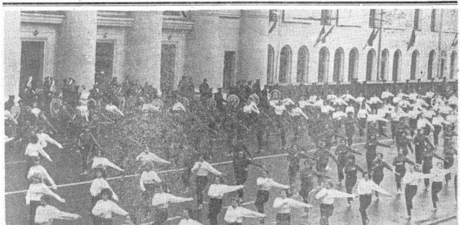
Красивым, впечатляющим было выступление наших студентов на первомайской демонстрации.