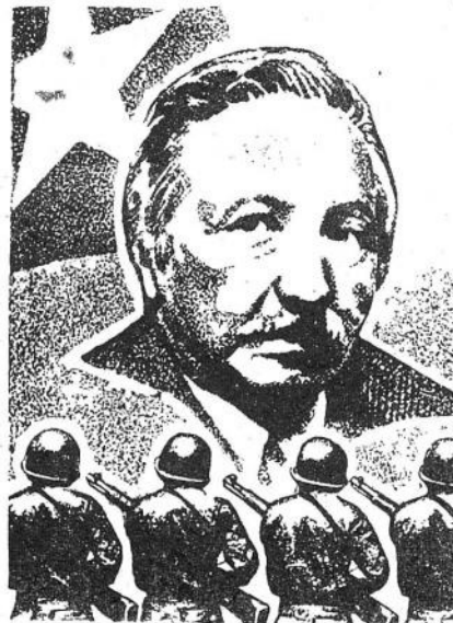
ИНСТИТУТ — СЕЛУ

4. Нашим конкретным ответом фашистам будет укрепление интернациональных связей с прогрессивными силами Латинской Америки, поддержка борьбы рабочего класса против эксплуатации и империализма, а также повышение наших усилий в деле подготовки высококвалифицированных, марксистских образованных учителей».