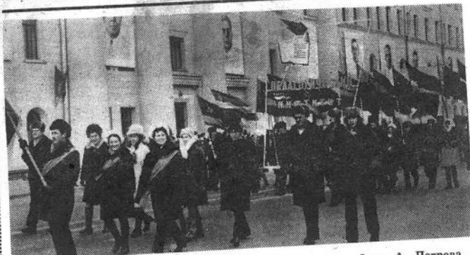
В праздничной колонне.