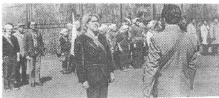
— Сборный эвакуопункт к работе готов!