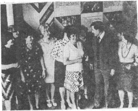
ЗЕСТИ С СОВЕТА ИНСТИТУТА

Газета основана в 1939 г. № 25 (591) | ПЯТНИЦА, 23 ИЮНЯ 1978 ГОДА | Цена 1 коп.