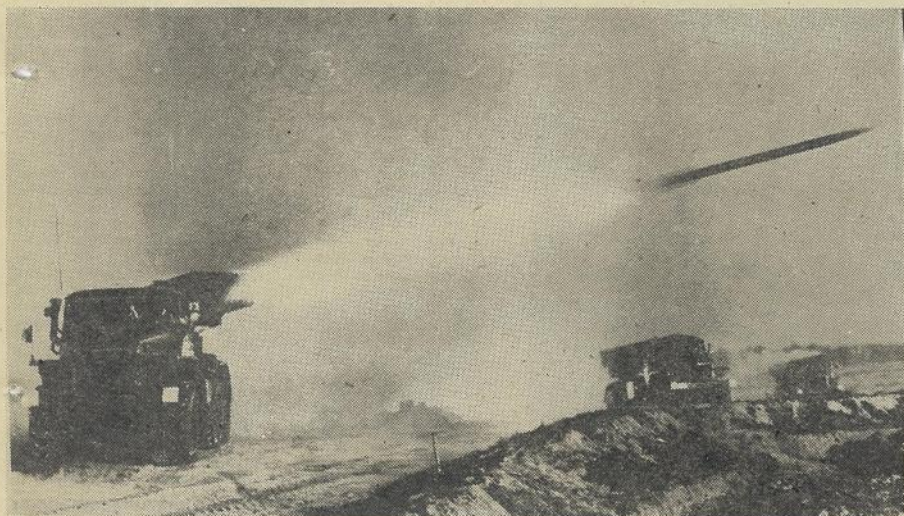
Ракетный щит Родины.

Газета основана в 1939 г. № 8 (574) ПЯТНИЦА, 24 ФЕВРАЛЯ 1978 ГОДА | Цена 1 коп.